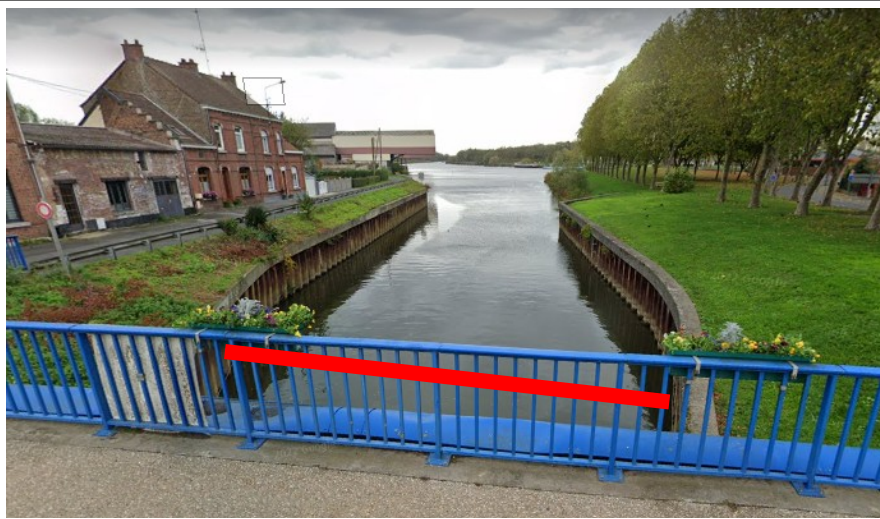
Pont de la Scarpe